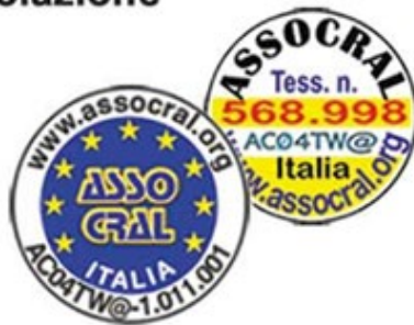
I Bollini sulle Tessere dei Cral