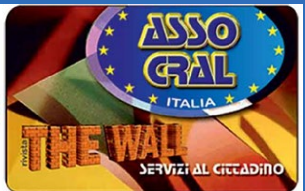
La tessera "Asso Cral" distribuita alle associazioni